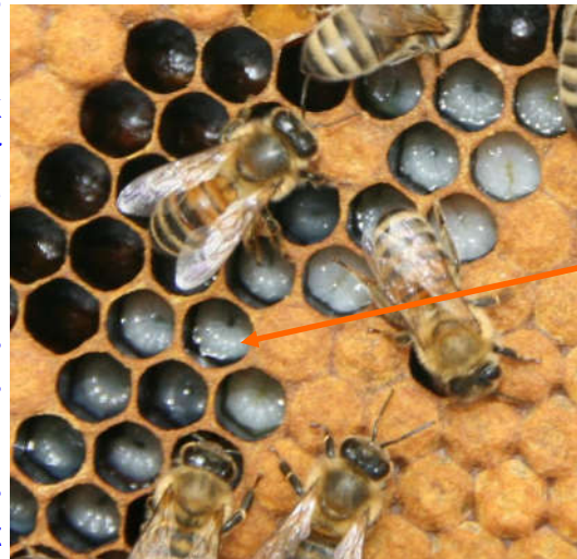
Larve, Stuij-meel en Eitje

Hoeveel bijen er gaan in een bijenkast en wie doet dan wat?