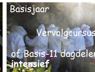
Basisjaar Vervolg cursus of Basis-11 dagdelen intensief