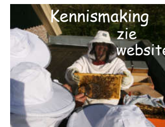
Kennismaking zie website