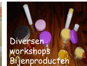
Diversen workshops Bijenproducten